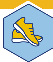
Prop D Atletismo y Recreación