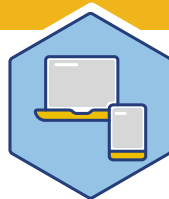
Prop C Tecnología