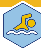
Prop E Centros Acuáticos