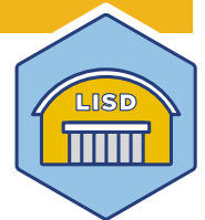
Prop G Instalaciones de Multiuso Interiores