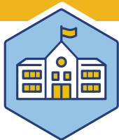
Prop B Proposición General