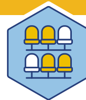
Prop F Estadios